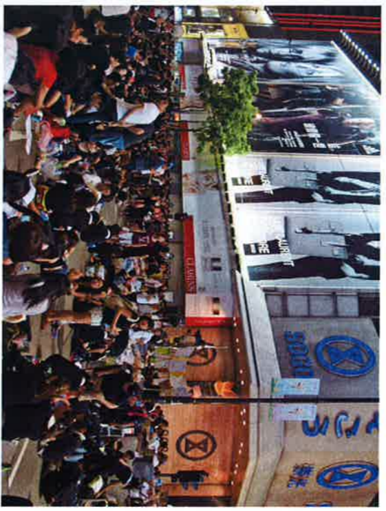
当初の計画とはかけ離れたオキュパイ・セントラル

「オキュパイ・セントラ ル」は、当初の名称が示 すように、「セントラルの空 から大学生の団体・学連は る状況であったためと言わ れ「民力」においても警 察に負けていたのです。 を占拠しはじめました。こ 港を訪れ、これらの「占拠 動員するには抽象的過ぎる 回掲載します)