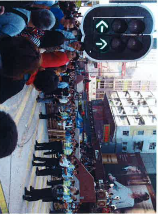
1カ月を超えた占拠行動。一部占拠地ではデモ隊と警官隊の衝突も頻発

9月28日に「セントラル占拠」として始まった各地での占拠行動は1カ月を超え、10月21日には特区政府と学生団体の初の対話が実現したもののデモ隊には至らず、デモ隊は政府の提示した内容に対し参加者の意思を問う占拠地での投票を計画しては棚上げするなど迷走。占拠行動が1カ月続いたことによる経済的な打撃が懸念され、10月中に実施されよう目まぐるしく変化する状況が政府から入れば影響を受けているとの見方がある。 (編集部 江藤和輝)